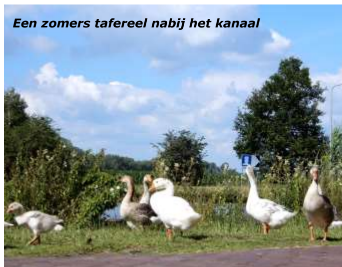
Een zomers tafereel nabij het kanaal

Deze, de 40 km-lopers, gaan hier een extra lus van ongeveer 10 km maken. Zij lopen door de bossen en het natuurgebiedje Ruweelsels. De naam staat voor een ruw begroeid moerasgebied. Momenteel bestaat het uit broekbos met kleine percelen grasland die leuke doorkijkjes bieden. We komen bij het Wilhelminakanaal. Dit 68 km lange kanaal loopt van de Zuid-Willemsvaart in de gemeente Laarbeek naar de Amercentrale in Geertruidenberg. We passeren twee markante punten: Sluis V, de laatste sluis in het Wilhelminakanaal en de brug de Deense Hoek, genoemd naar de nabijgelegen buurtschap. Inmiddels is sluis V niet alleen buiten gebruik gesteld, maar ook grotendeels afgebroken. Slechts de contouren zijn nog zichtbaar.