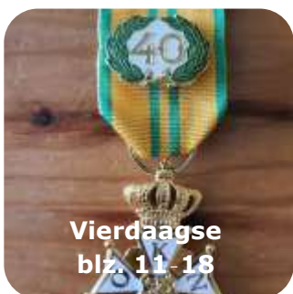
Vierdaagse blz. 11-18