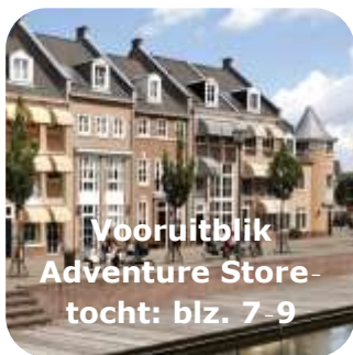
Vooruitblik Adventure Store- tocht: blz. 7-9