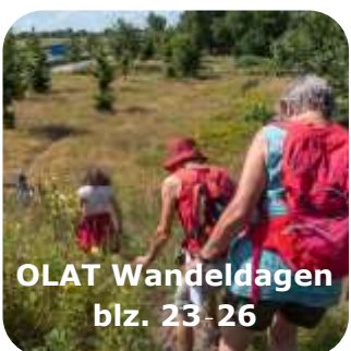
OLAT Wandeldagen blz. 23-26