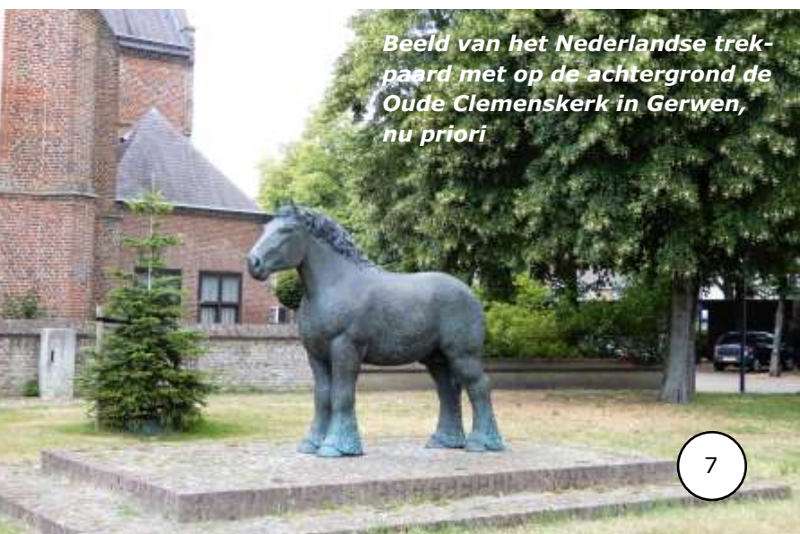
Beeld van het Nederlandse trekpaard met op de achtergrond de Oude Clemenskerk in Gerwen, nu priori

De route leidt ons door het buurtschapje Alverschool. Gerwen komt in zicht en daarmee de caférust. Deze is bij het gezellige dorpscafé De Stam aan de Gerwenseweg. Een prima plekje om de benen even rust te gunnen.