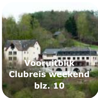
Vooruitblik Clubreis weekend blz. 10